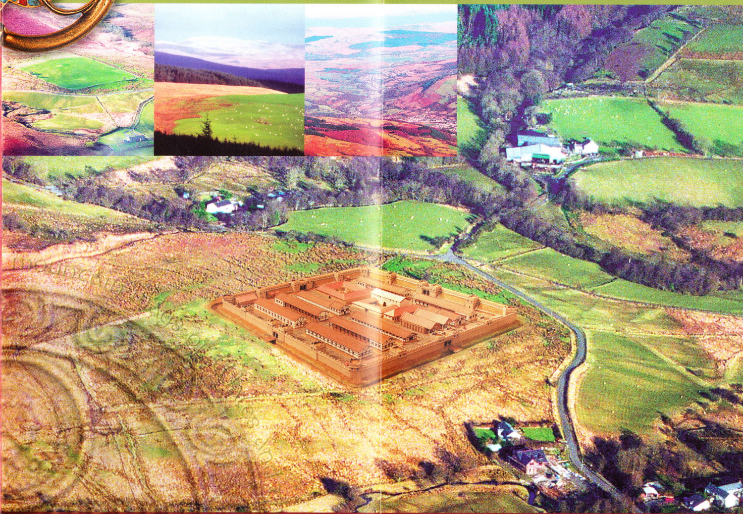
Artist's impression of fort on site.

ymlaen at Gwyd Banwen. Treulwch dipyn o amser yma yn mwynhau'r olygfa, sy'n edrych allan at Gaer Coelbren (neu Banwen Gaer fel y mac'r dool leol yn ei galw) a Phen-y-fan yn y pellter Gerllaw, mae yna epelychiadau o'r hyn a elwir yn Faenau Cnoll (carreg Macaraidd Rhufain-Brycheiniog o'r bed ganrif ac arni ysgrifen, a charreg Hirfynydd o tua'r 10fed ganrif), wedi'u gosod yn agos at y man gwreiddiol. Peidiwch â cholli'r cofaruwydd gerllaw, sy'n enui copaon awyrlin Bannau Brycheiniog. Cwch i lawr at dai teras yr Heol Rufeinig, Clos Banwen, mae Cwethdy Dove a Phrifysgol Cymunedol y Cymoedd yn darparu amryniacth ddyfeistgar o gyfleusterau addysgol. Yn agosach at yr A4109 sy'n rhedeg o feun y cum mae Tafarn y Banwen, lle (yn ôl chwedlonaeth), y ganwyd Sant Padrig. Tu huwt i'r A4109 ac i'r dduyrain o Heol Camnant mae yna dystiolaeth o Faes Ymderchio Rufeinig o ryw 35 erw. Yn syth ymlaen mae Gaer Coelbren. Mac'r gaer, a adeiladwyd yn y 70au OC, yn 5.2 erw, sy'n ddigon i gynnal carchar o 500 o ddynion a marchfilwyr, o leiaf. Tra'i bod o ddiddordeb sylweddol, gofynnir i ymwelwyr darchu'r ffarch nad oes hawl mynediad at y safle Rhestredig yma (y mae'n bosib bod cnydau yn tyfu arno). Mae Sarn Helen yn parhau i'r gogledd-dduyrain, i gaer ger Aderhonddu (Y Gaer) ac yna ymlaen at Caernarfon (Segontium).